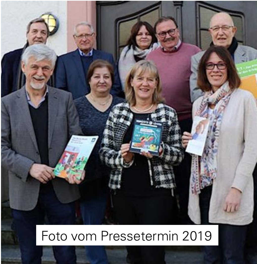
Foto vom Pressetermin 2019